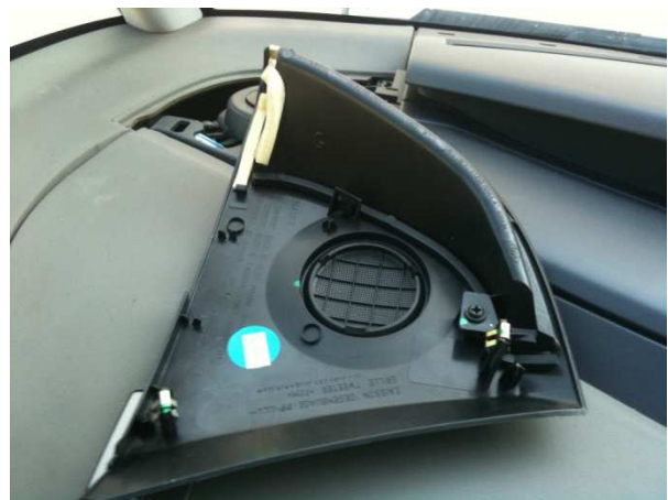
Sous le cache vous pouvez apercevoir les points d'accroche.