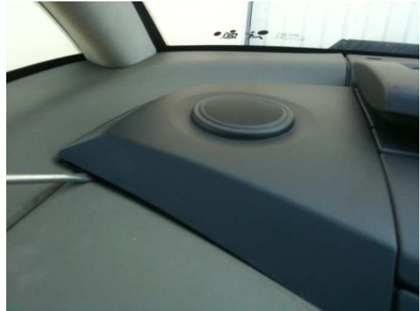
Faire levier en prenant soin de ne pas trop écraser la mousse. Pour cela utiliser un outil large.