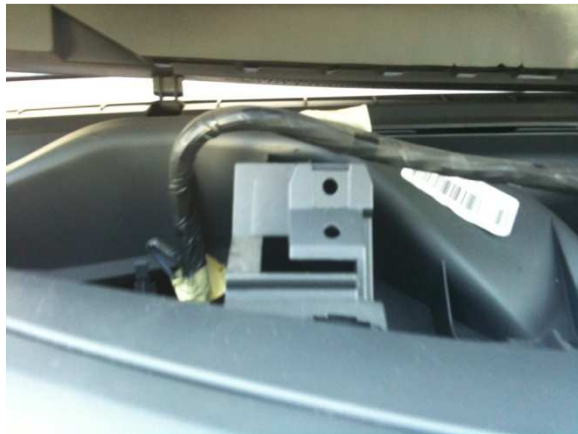
Conservez les clips