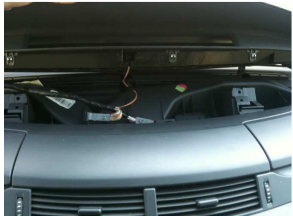
Le tableau est retiré