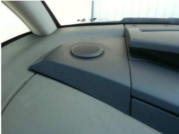
De chaque côté de la planche de bord