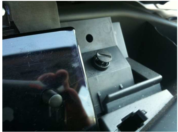
Faites \frac{1}{4} de tour afin de déverrouiller les clips