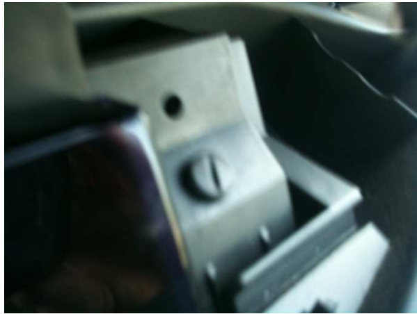
Sur chaque côté du bloc à expédier :